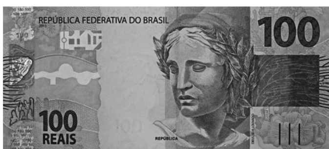
Nota de R$ 100

Após 28 anos de existência, nota de R$ 100 compra em 2022 o mesmo que R$ 13,91 em 1994